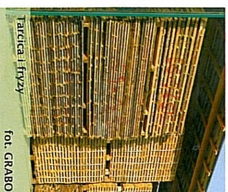
Tarcica i fryzy