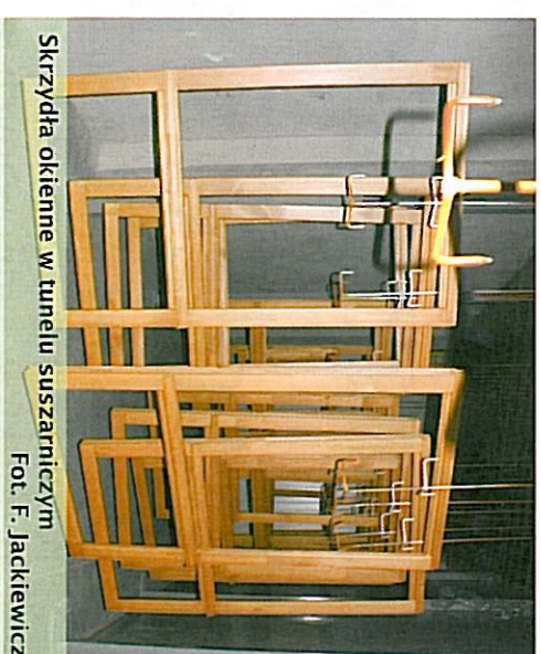
Skrzydła okienne w tunelu suszarniczym