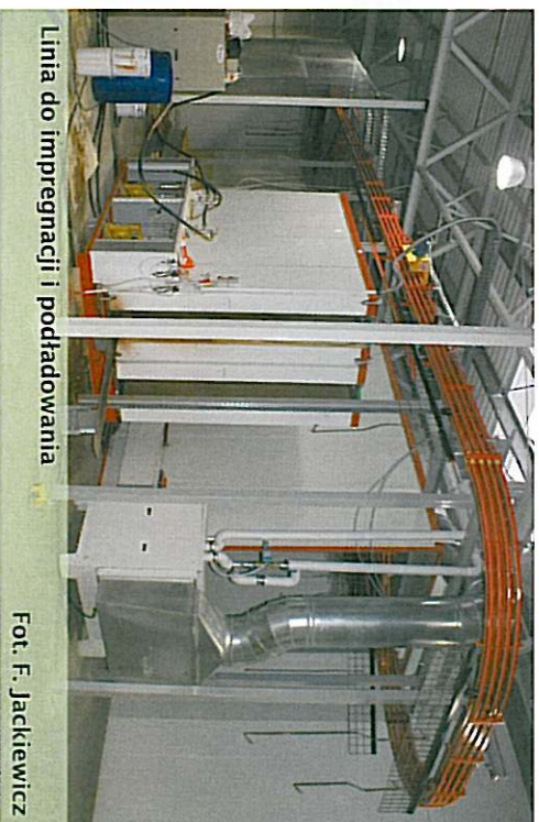
Linia do impregnacji i podładowania